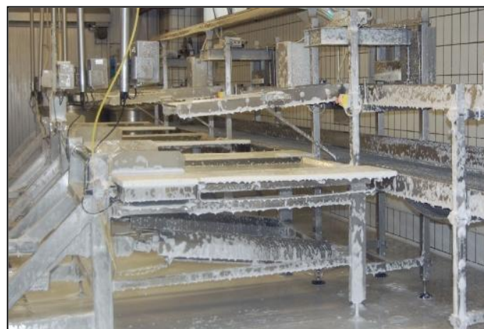
2 Azione chimica